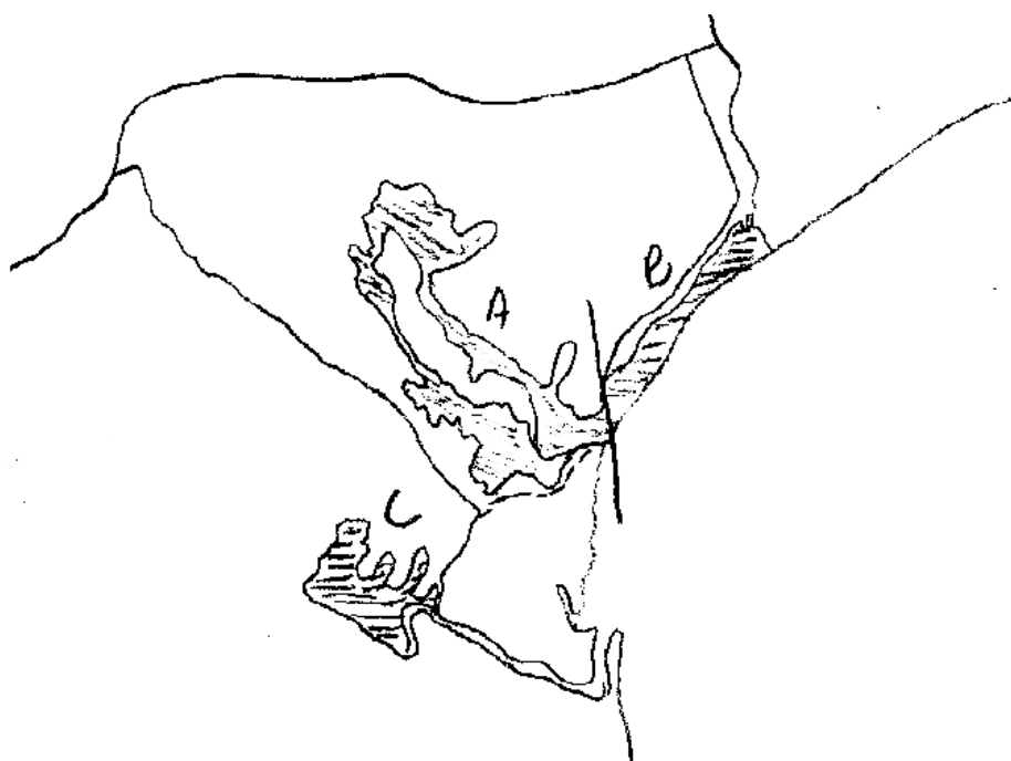
Figura 3. Municipio Guane

El municipio Guane cuenta con un área cubierta por mangle prieto de 1023.0 Ha, que para su estudio fueron divididas en 3 secciones (Figura 4) teniendo en cuenta la posibilidad de acceso a las mismas.