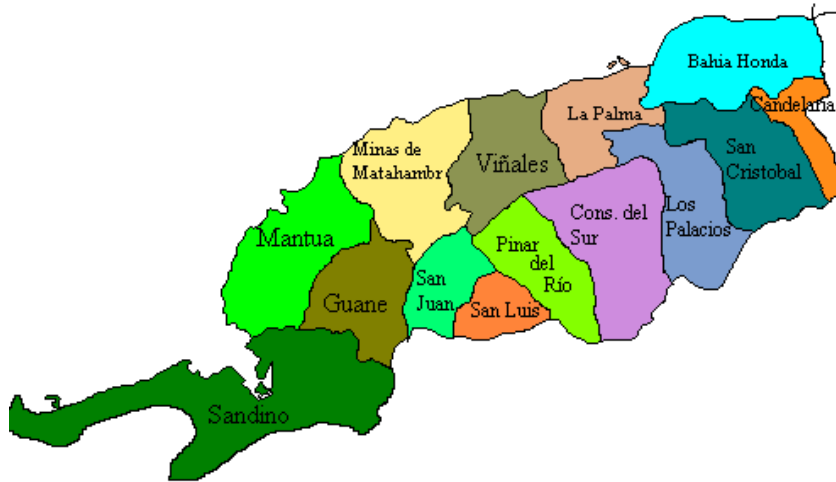
Figura 1. Esquema de localización de los municipios

La vegetación que predomina en sus costa del mar hacia tierra adentro es como sigue: